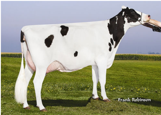
DEGROOT REFLECT 1000