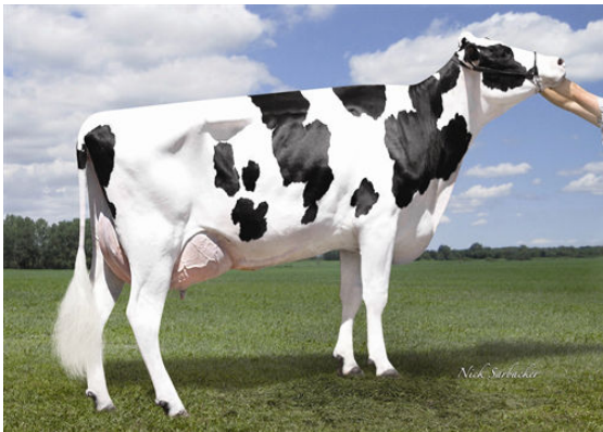
OLD ACRES REFLECT MARVELOUS